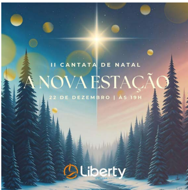
CANTATA DE NATAL DA IGREJA LIBERTY A Igreja Liberty convida a todos para sua Cantata de Natal, que será realizada no dia 22/12, às 19h, na Liberty, que fica localizada na Av. 7 (entre as ruas 28x30), nº 1228.