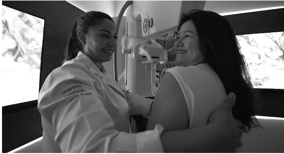
O exame de mamografia deve ser realizado por mulheres de 40 a 69 anos periodicamente (Foto tirada antes da pandemia por Covid-19)

Segundo o Instituto Nacional de Câncer (INCA), são diversos os fatores causadores de câncer de mama. Entre eles, está o sedentarismo, ou seja, a inatividade física.